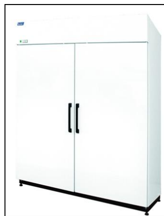
Typ „S 1200 / S1400 AG“

rozsah pracovní teploty: -1°C do +8°C úsporný chladicí agregát, R507 automatické odtávání, plně dveře statické chlazení (ventilované za příplatek) vnější provedení odolný bílý lak vnitřní prostor mačkaný hliník typ S500 a S700 – 5 ks stavitelných roštů typ S1200 a S1400 – 10 ks stavitelných roštů verze „S AG“ – auto odpař. kondenzátu, agregát nahoře