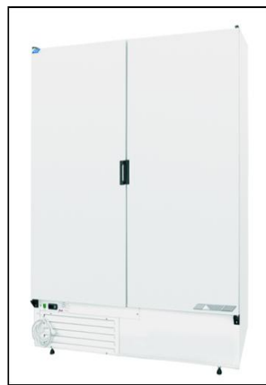
Typ „S 1200 / 1400“